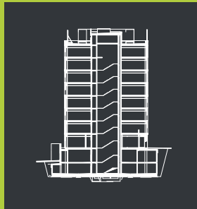
Przekrój Cross section