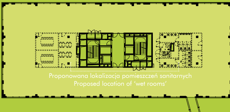
Rzut typowego piętra Standard floor plan