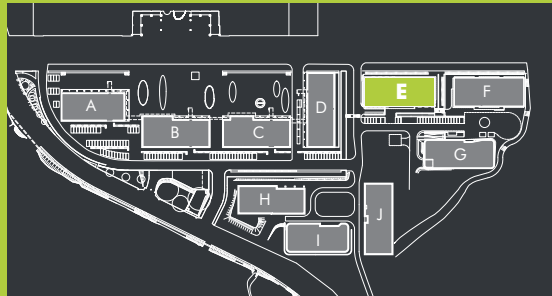
Lokalizacja w kompleksie Location within the complex